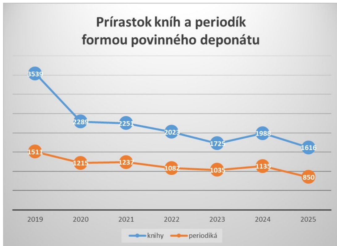
Obrázok 2 Prírastok fondu formou povinného deponátu v rokoch 2019 - 2025